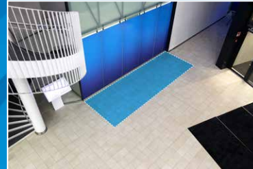
Paikka 1 12 m 2