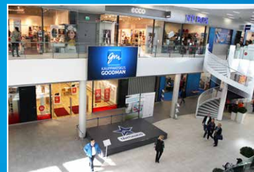
Paikka 4 LAVA 15 m 2

Huom! Kysy Tähtiaukion Jumboscreenin käyttöä.