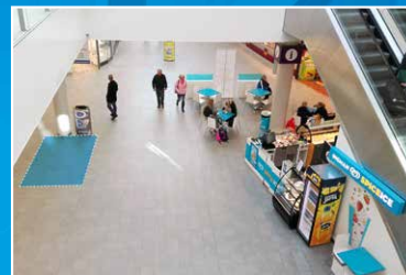
Paikka 2 6 m 2