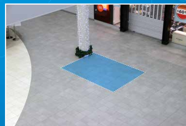
Paikka 5 6 m 2

Huom! Kysy Tähtiaukion Jumboscreenin käyttöä.